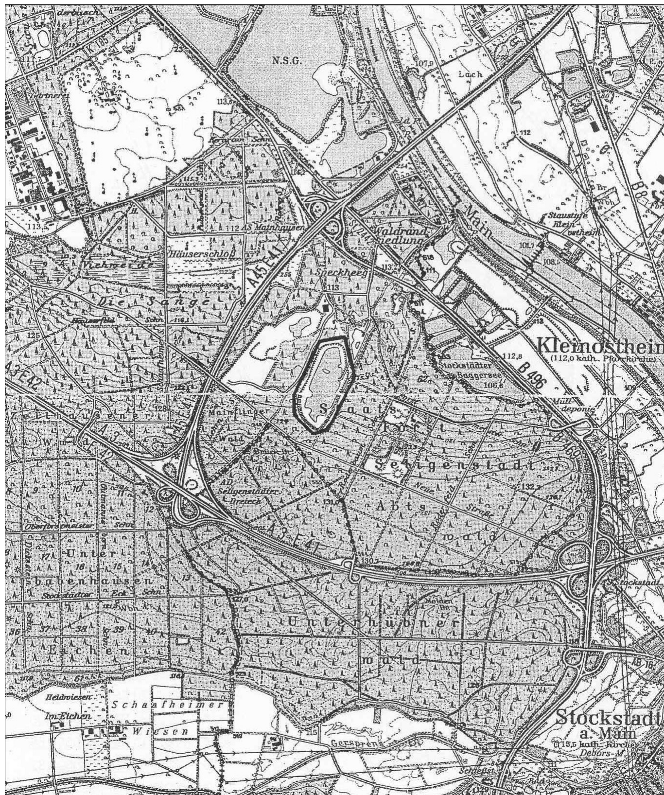
Anlage 1 Auszug aus Top. Karte, Maßstab 1 : 25 000, Blätter 5920 und 6020 des Hessischen Landesvermessungsamtes Vervielfältigungsgenehmigung Nr. 03 – 1 – 007 Übersichtskarte als Anlage zur Verordnung über das Naturschutzgebiet „Ehemalige Tongrube von Mainhausen“