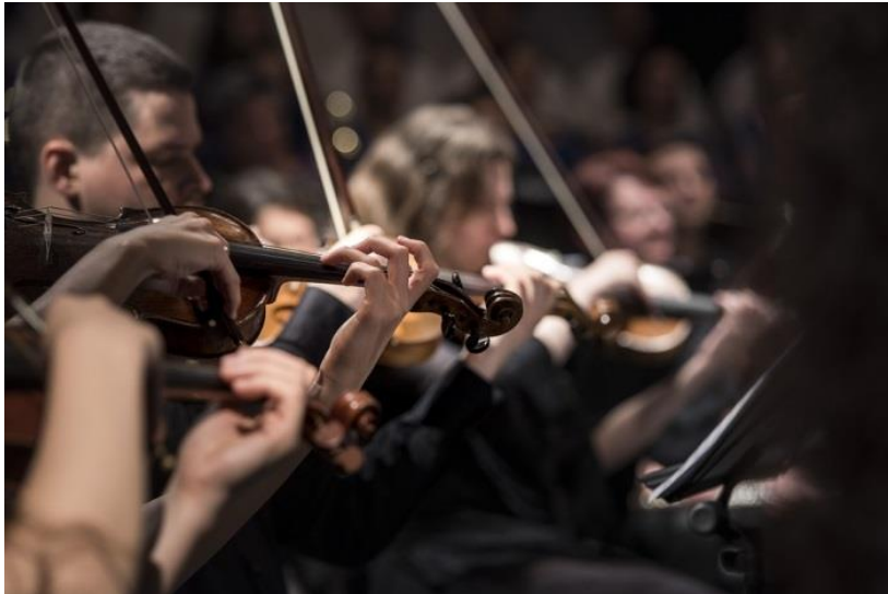
Orchesterprojekt als Beispiel für Projektförderung