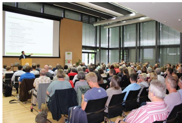
↑ Informationsveranstaltung zur neuen Datenschutzgrundverordnung im Kreishaus in Dietzenbach