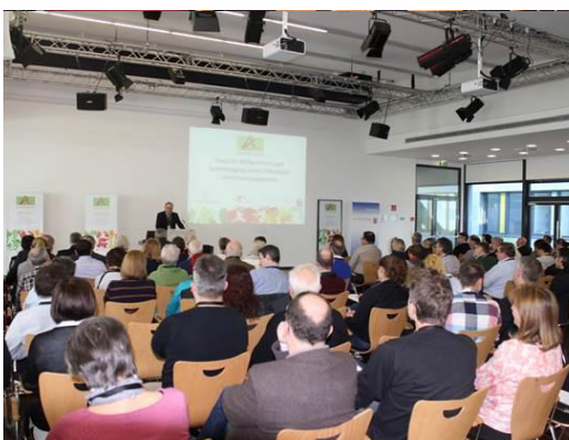
↑ Eröffnung des Sportkongresses am 24. März 2018 im HLL in Dreieich